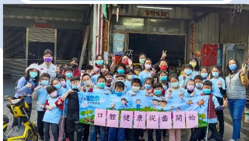
育仁國小 淨村強化社區口腔保健觀念