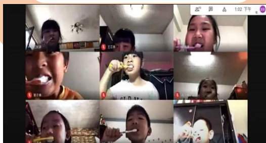
石門國小 教師線上指導餐後潔牙