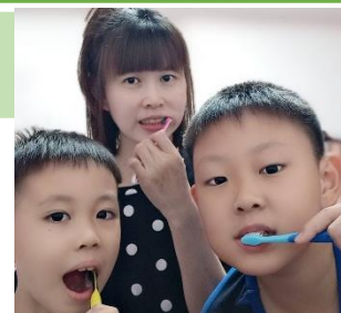
內埔國小 健康抵家-全家一同潔牙