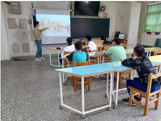
辦理菸、檳危害防制高關懷小團體輔導，針對高風險學生進行戒菸教育