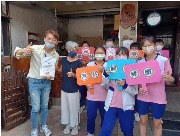
菸檳危害防制教育相關宣導立牌設置與教具製作使用