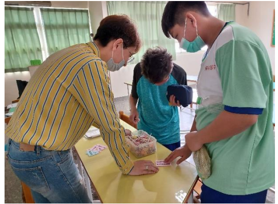
學生透過搶答正確及用心填寫回饋學習單內容，獲得獎金代幣換取獎勵品