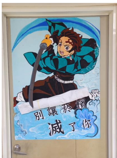
藉由班級教室布置結合反菸拒檳主題，宣導班級學生健康禁菸檳危害觀念，達成境教效果