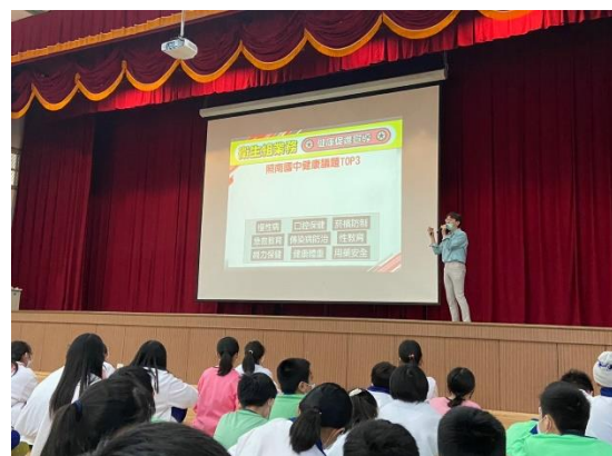
111學年度第一學期師生朝會宣導健康促進議題—菸檳防制宣導