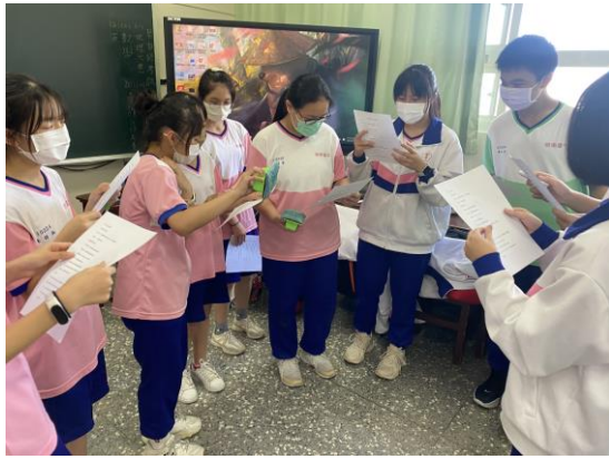
表演藝術結合菸檳防制創作劇本演練