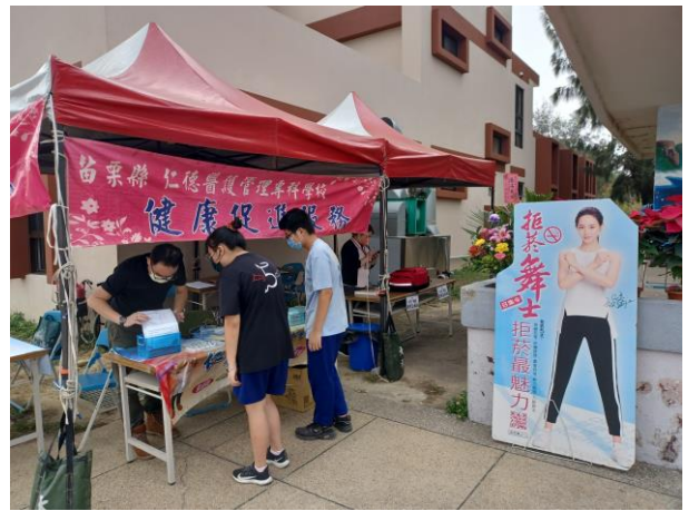
菸檳危害防制教育相關宣導立牌設置與教具製作使用