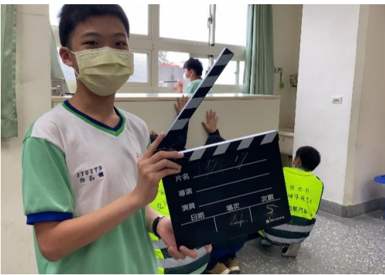
班級創作拍攝拒菸反檳短片作品，建構無菸檳健康校園文化