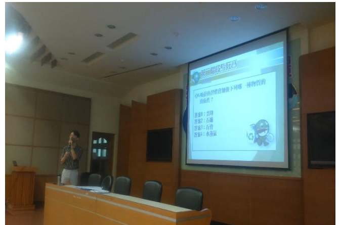
舉辦校內環境知識競賽，環境知識題庫涵蓋吸菸造成的環境汙染知識，讓學生學習吸菸對環境造成的壞處影響