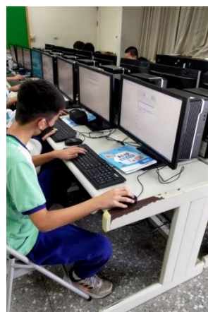
透過國立陽明交通大學菸檳教育學生感知問卷前、後測，了解學生對於菸檳的概況並分析