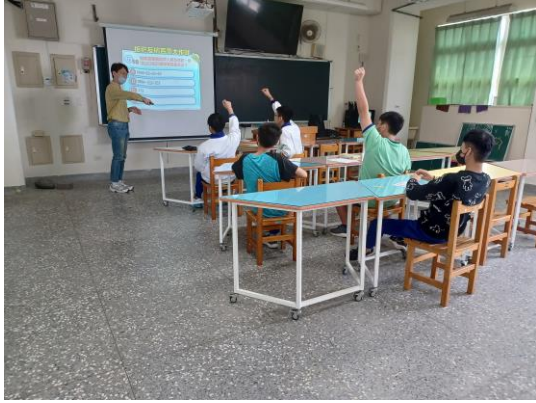
高關懷小團體戒菸檳教育輔導—拒菸反檳百萬大作戰，學生進行菸檳危害問題搶答