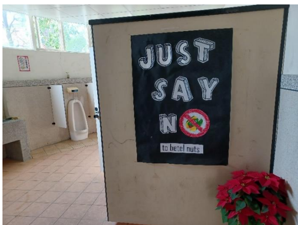
藉由校園廁所美化結合反菸拒檳主題，宣導班級學生健康禁菸檳危害觀念，達成境教效果