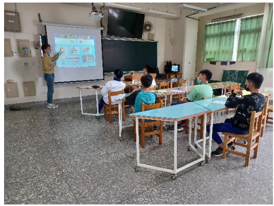
高關懷小團體戒菸檳教育輔導—菸魔現身，簡介不同形式的新興菸品