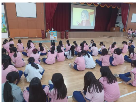
結合社區竹南衛生所醫護團隊人員，提供學生菸檳防制相關衛教教育與支援諮詢