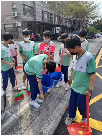
學校組織社區菸檳防制志工團隊，進行社區清潔掃街活動，同時配合社區周遭店家宣導共同營造無菸檳環境