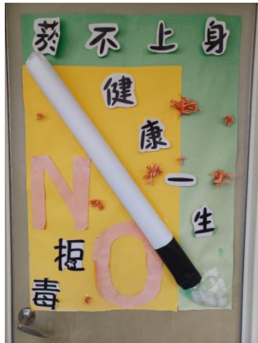
藉由班級教室布置結合反菸拒檳主題，宣導班級學生健康禁菸檳危害觀念，達成境教效果