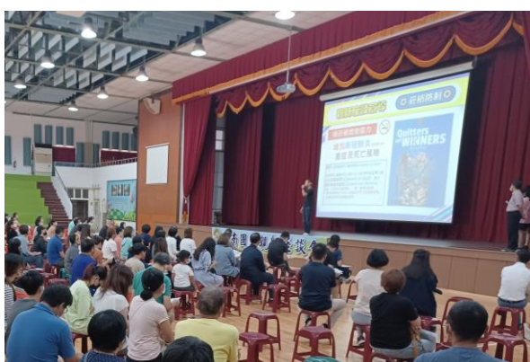
學校辦理親師座談會暨家長菸檳防制宣導，邀請家長共同響應無菸檳家庭，並提醒留意學生新型態電子加熱菸品