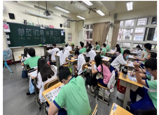
學生發揮創意創作菸檳防制標語 POP 美工字插圖活化標語