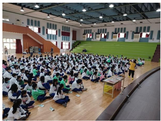
學生反菸拒檳校園宣導講座「如果人生可以重來」，最後以有獎徵答鼓勵學生回應，增強戒菸反檳動機與技能