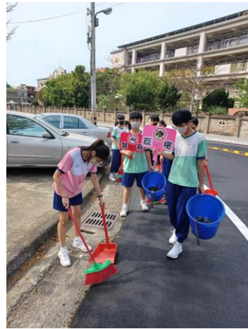
學校組織社區菸檳防制志工團隊，進行社區清潔掃街活動，同時配合社區周遭店家宣導共同營造無菸檳環境