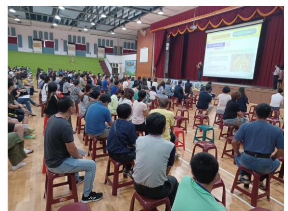
學校辦理親師座談會暨家長菸檳防制宣導，提供家長無菸家庭教育諮詢