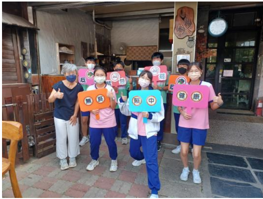
學校組織社區菸檳防制志工團隊，進行社區清潔掃街活動，同時配合社區周遭店家宣導共同營造無菸檳環境