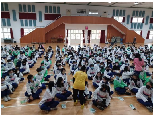
學生反菸拒檳校園宣導講座「如果人生可以重來」，最後以有獎徵答鼓勵學生回應，增強戒菸反檳動機與技能