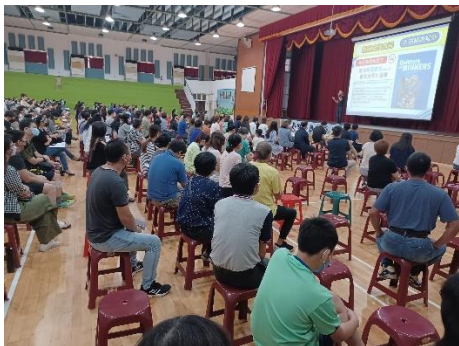
學校辦理親師座談會暨家長菸檳防制宣導，邀請家長共同響應無菸檳家庭，並提醒留意學生新型態電子加熱菸品