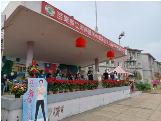
校慶運動會結合校園反菸拒檳主題宣導，對於參與校慶運動會的全體師生及家長一併宣導校園與家庭反菸拒檳觀念