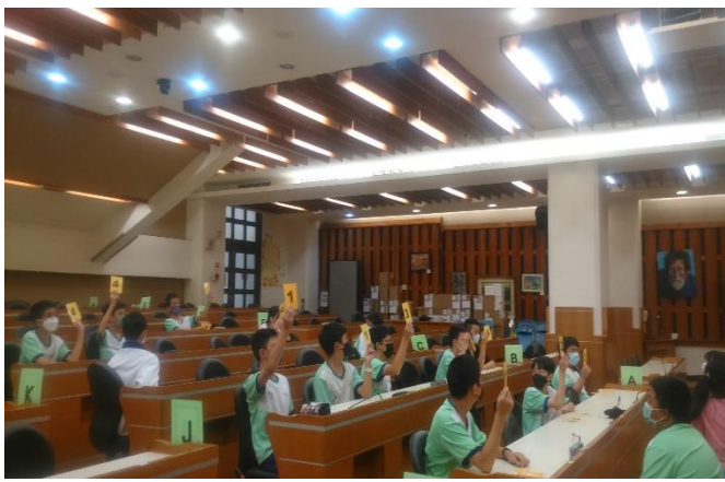
舉辦校內環境知識競賽，環境知識題庫涵蓋吸菸造成的環境汙染知識，讓學生學習吸菸對環境造成的壞處影響