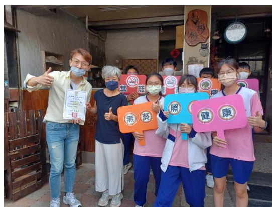
菸檳防制志工無菸檳社區營造宣導活動，呼籲社區居民及店家共同響應反菸拒檳態度，頒發感謝狀感謝店家共同響應反菸拒檳活動