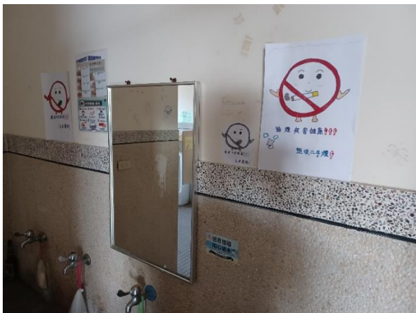
藉由校園廁所美化結合反菸拒檳主題，宣導班級學生健康禁菸檳危害觀念，達成境教效果