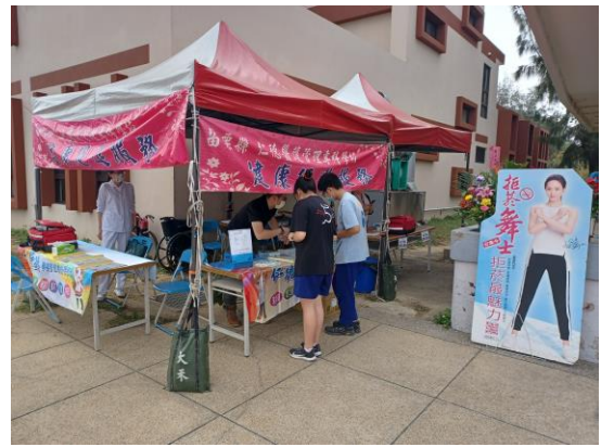
校慶運動會結合校園反菸拒檳主題宣導，對於參與校慶運動會的全體師生及家長一併宣導校園與家庭反菸拒檳觀念