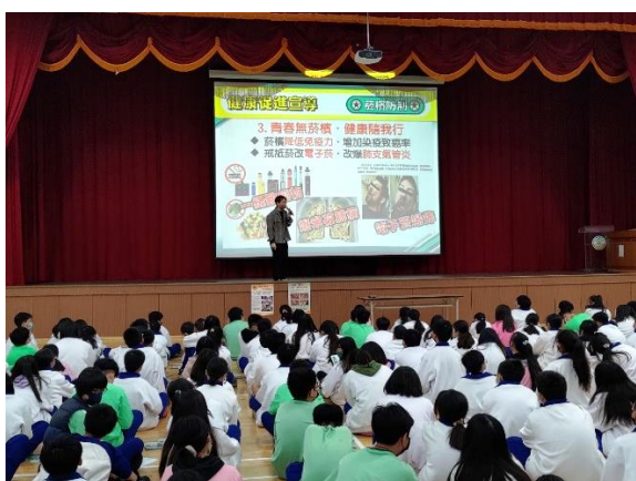
111學年度第二學期師生朝會宣導健康促進議題—電子菸對人體危害