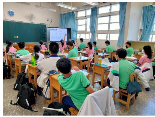
學生認知菸品及檳榔對人體危害影響