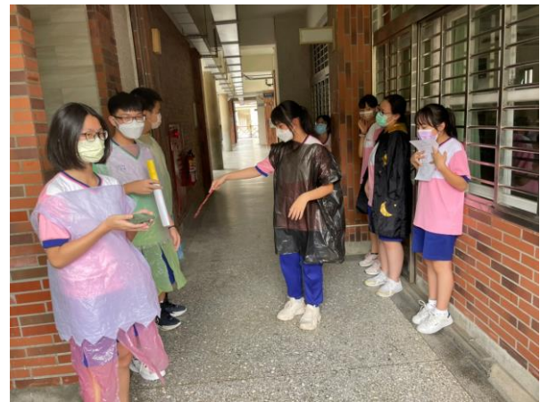
菸檳危害防制教材融入表演藝術課程教學活動——結合表演無所不在章節，班級創作菸檳防制短片，逐步建構無菸檳健康校園文化