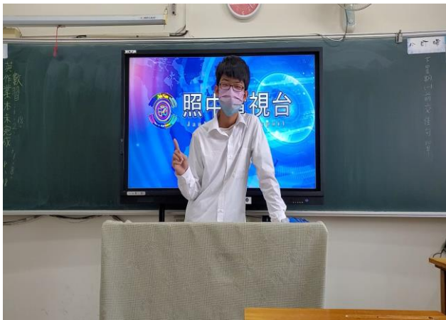
菸檳危害防制教材融入表演藝術課程教學活動——結合表演無所不在章節，班級創作菸檳防制短片，逐步建構無菸檳健康校園文化