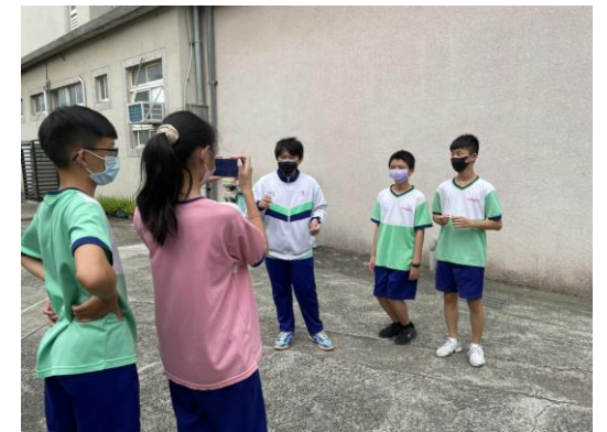
班級創作拍攝拒菸反檳短片作品，建構無菸檳健康校園文化