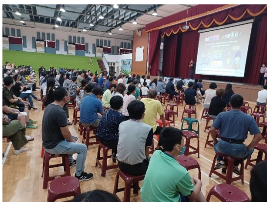
學校辦理親師座談會暨家長菸檳防制宣導，提供家長無菸家庭教育諮詢