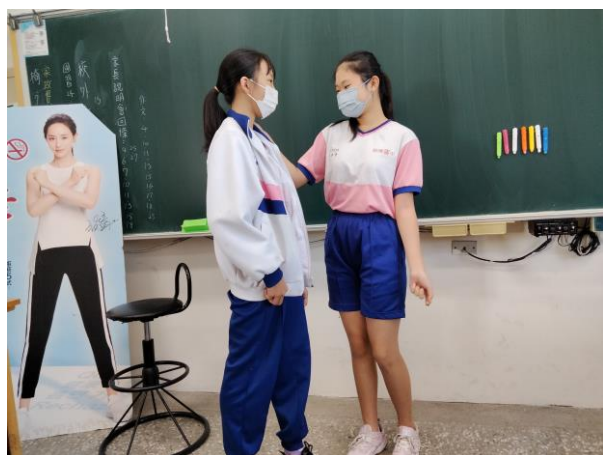
菸檳危害防制教材融入健康教育課程教學活動—結合菸誤人生章節，學生學習健康紓壓方式、拒絕菸檳態度及技巧