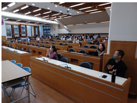
111 學年度期初校務會議暨衛生健康促進委員會會議，擬定通過本校菸檳防制計畫及活動