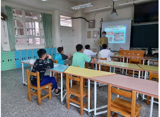
高關懷小團體戒菸檳教育輔導—打擊菸勢力，分析菸品及電子煙對人造成的負面傷害及風險