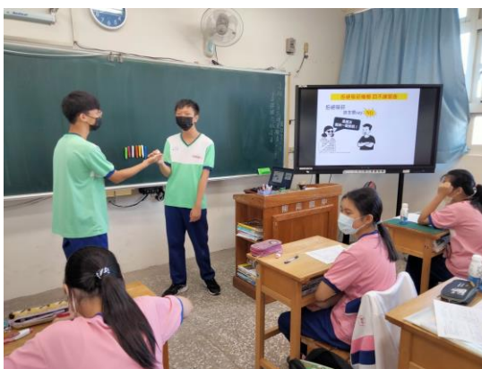
學生演練拒絕菸檳技巧—四不練習曲