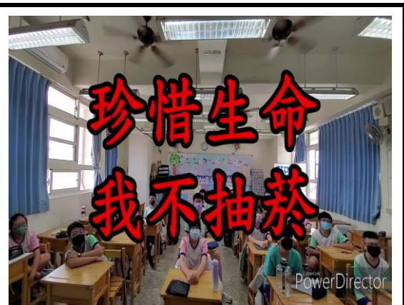
學生成為拒菸反檳大使共同宣導，優異班級短片作品代表參賽