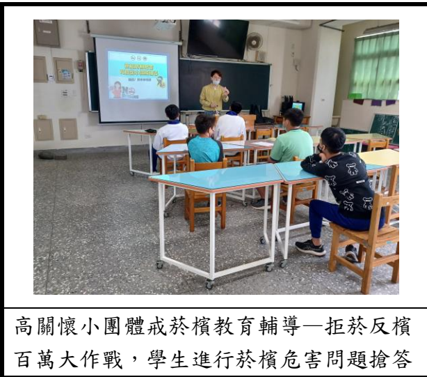
高關懷小團體戒菸檳教育輔導—拒菸反檳百萬大作戰，學生進行菸檳危害問題搶答