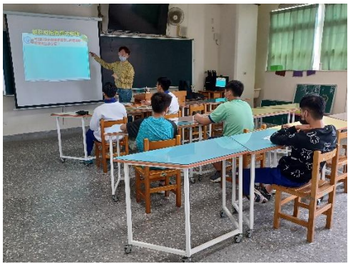
辦理菸、檳危害防制高關懷小團體輔導，針對高風險學生進行菸檳防制教材教學，透過有獎搶答活動了解健康危害知多少