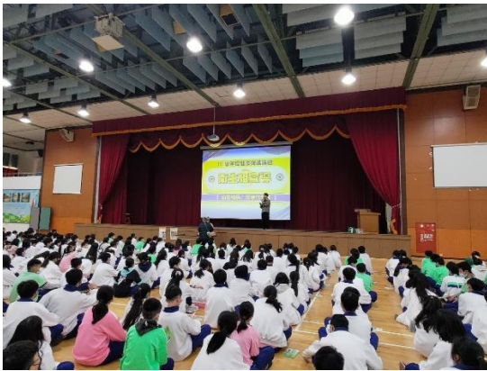
師生朝會宣導學校健康促進議題—菸檳防制宣導