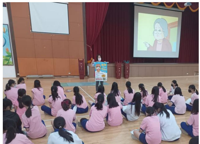
結合社區竹南衛生所醫護團隊人員，提供學生菸檳防制相關衛教教育與支援諮詢