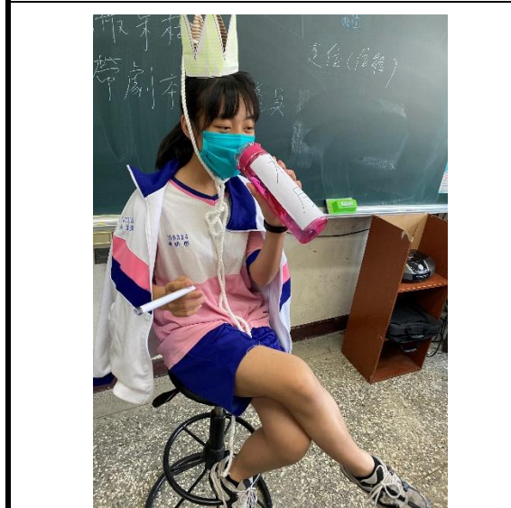
透過多元課程學習生活技能的融入，落實防菸拒檳課程與教學