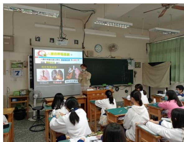
菸檳危害防制教材融入生物課程教學活動—結合人體呼吸與氣體恆定章節，展示長期吸菸者實際肺部標本照片，警惕菸品對人體危害影響