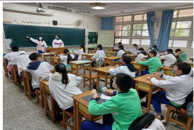
班會主題討論菸檳危害相關問題，共同探討並建構出對於菸檳對於人體影響的正確知識