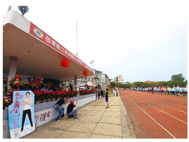
校慶運動會結合校園反菸拒檳主題宣導，對於參與校慶運動會的全體師生及家長一併宣導校園與家庭反菸拒檳觀念