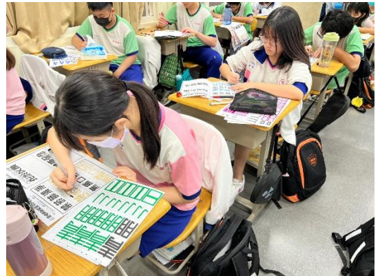
學生發揮創意創作菸檳防制標語 POP 美工字插圖活化標語