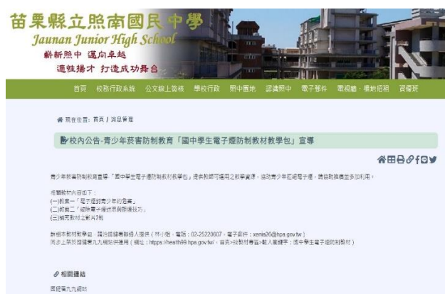
學校設置連結菸檯防制教育、無菸無檯好校園資源網站