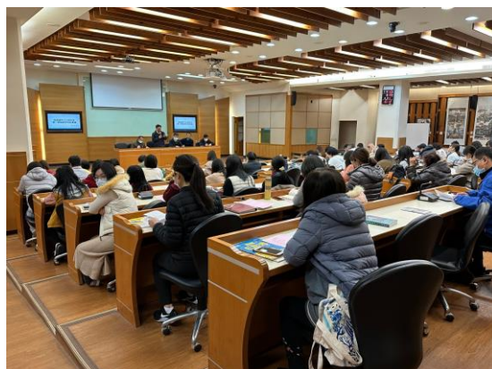
111 學年度期末校務會議暨衛生健康促進委員會會議，擬定通過本校菸檳防制計畫及活動