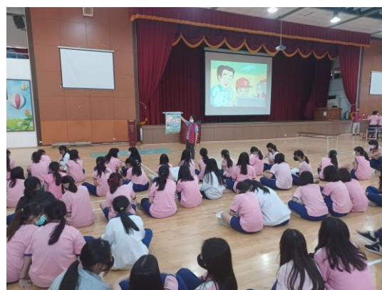
結合社區竹南衛生所醫護團隊人員，提供學生菸檳防制相關衛教教育與支援諮詢