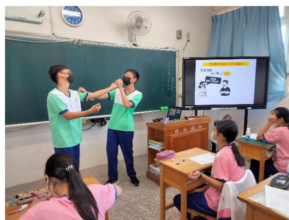
菸檳危害防制教材融入健康教育課程教學活動—結合菸誤人生章節，學生學習健康紓壓方式、拒絕菸檳態度及技巧