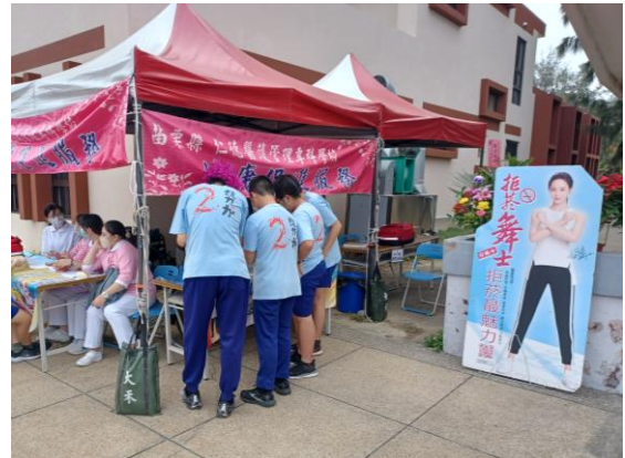
校慶運動會結合仁德護專健康醫護團隊設立菸檳防制健康宣導攤位，介紹同學認知菸檳危害對人體的影響，並提供相關衛教諮詢