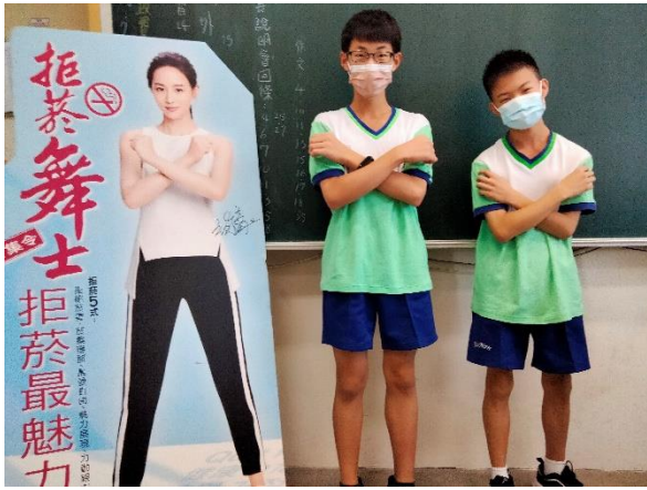
透過多元課程學習生活技能的融入，落實防菸拒檳課程與教學