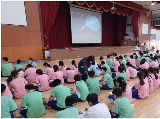
於朝會、週會時間全體師生欣賞菸檳防制影片宣導，藉由影片宣導加強菸檳防制健康教育