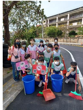
學校組織社區菸檳防制志工團隊，進行社區清潔掃街活動，同時配合社區周遭店家宣導共同營造無菸檳環境