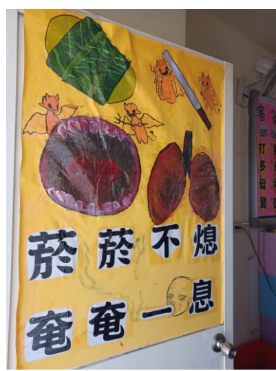
藉由班級教室布置結合反菸拒檳主題，宣導班級學生健康禁菸檳危害觀念，達成境教效果