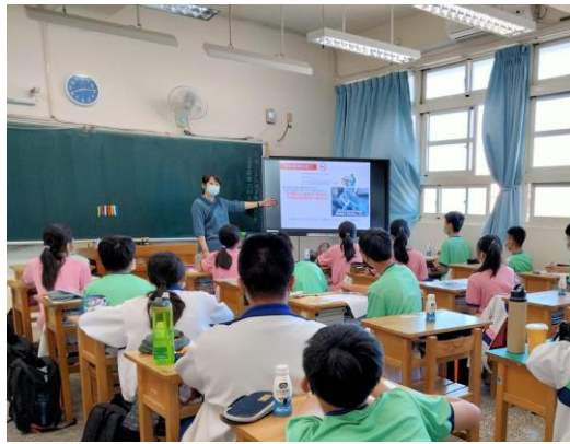
學生認知菸品及檳榔對人體危害影響