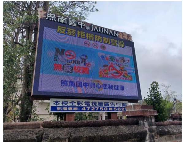
校門口LED電子看板播放菸檳危害防制相關宣導訊息