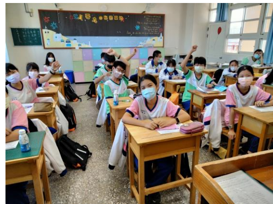
融合正向心理健康議題培養正向態度，學生學習健康紓壓方式、拒絕菸檳態度及技巧