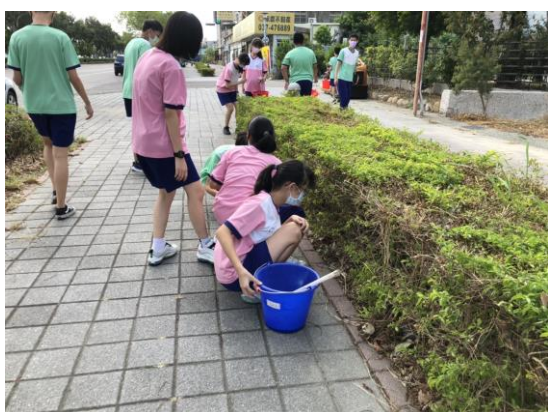
菸檳防制志工無菸檳社區營造宣導活動，進行社區清潔掃街活動，營造無菸檳健康社區