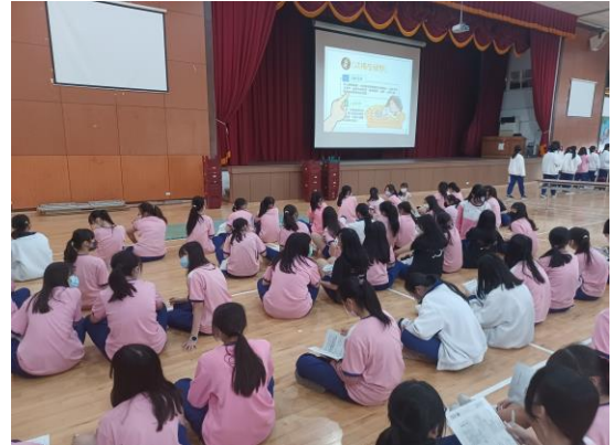
於朝會、週會時間全體師生欣賞菸檳防制影片宣導，藉由影片宣導加強菸檳防制健康教育