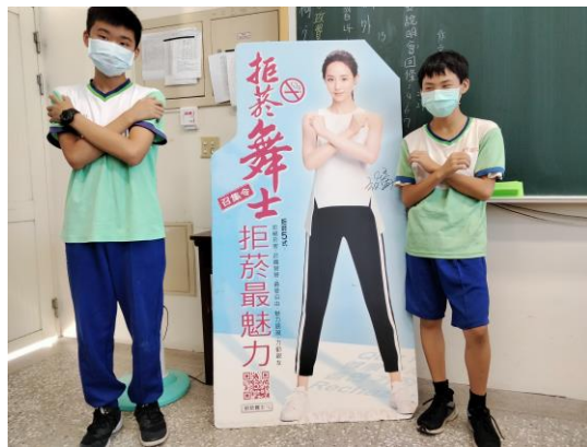
融合正向心理健康議題培養正向態度，學生學習健康紓壓方式、拒絕菸檳態度及技巧