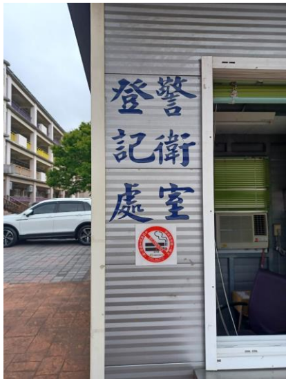
落實禁菸拒檳健康校園政策，並請教職員工以身作則，禁止於校內吸菸(含電子菸)