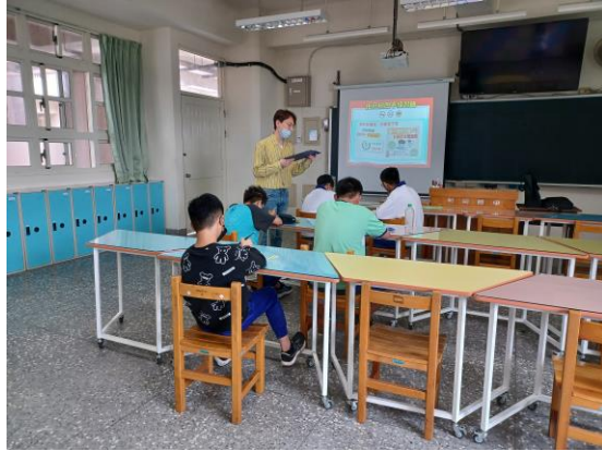
高關懷小團體戒菸檳教育輔導—拒菸檳四不練習曲，學生學習選擇適合自己的方式並演練回饋於心得學習單