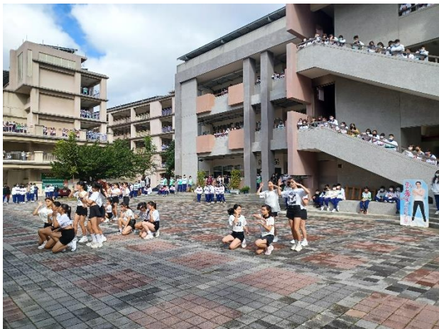
校園拒菸舞士快閃表演活動，透過熱舞表演展現健康活力，熱舞社同學成為拒菸舞士，宣導學生遠離菸檳危害的正當休閒活動