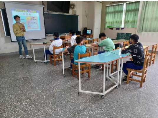
高關懷小團體戒菸檳教育輔導—打擊菸勢力，分析菸品及電子煙對人造成的負面傷害及風險