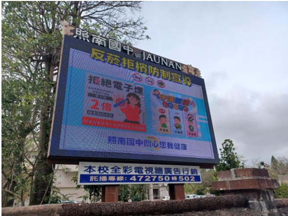
校門口LED電子看板播放菸檳危害防制相關宣導訊息