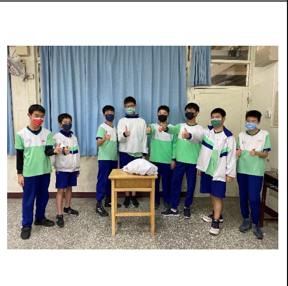
透過多元課程學習生活技能的融入，落實防菸拒檳課程與教學