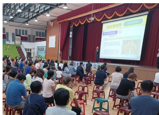
學校辦理親師座談會暨家長菸檳防制宣導，邀請家長共同響應無菸檳家庭，並提醒留意學生新型態電子加熱菸品