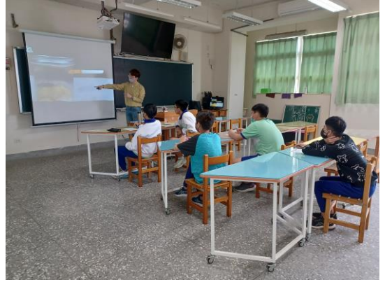
高關懷小團體學生欣賞網路實驗影片，由實驗結果警惕自身遠離菸害