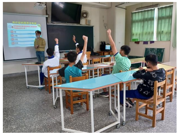
辦理菸、檳危害防制高關懷小團體輔導，針對高風險學生進行戒菸教育