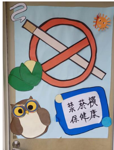
藉由班級教室布置結合反菸拒檳主題，宣導班級學生健康禁菸檳危害觀念，達成境教效果