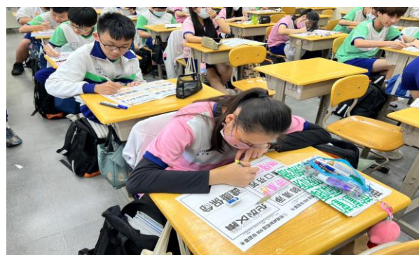
菸檳危害防制教材融入藝術與人文課程教學活動—結合優游「字」在章節，學生完成菸檳防制標語學習單後達到境教效果