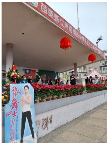
校慶運動會結合校園反菸拒檳主題宣導，對於參與校慶運動會的全體師生及家長一併宣導校園與家庭反菸拒檳觀念