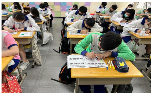
菸檳危害防制教材融入藝術與人文課程教學活動—結合優游「字」在章節，學生發揮創意創作菸檳防制標語POP美工字插圖活化標語