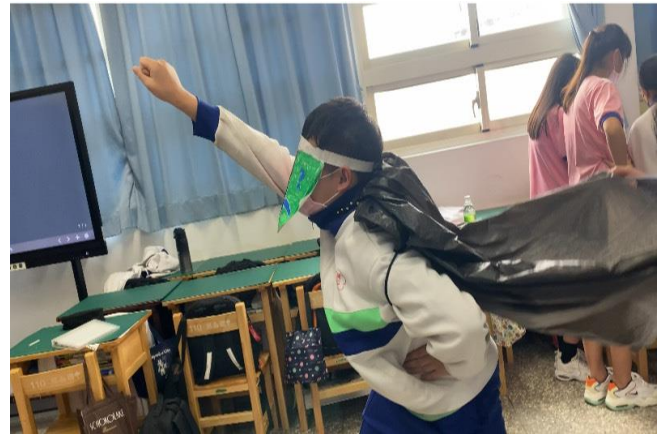
透過多元課程學習生活技能的融入，落實防菸拒檳課程與教學