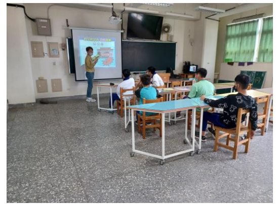
高關懷小團體戒菸檳教育輔導—打擊菸勢力，分析菸品及電子煙對人造成的負面傷害及風險