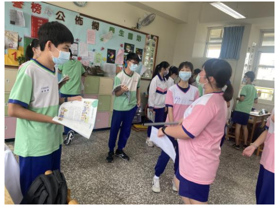
表演藝術結合菸檳防制創作劇本演練