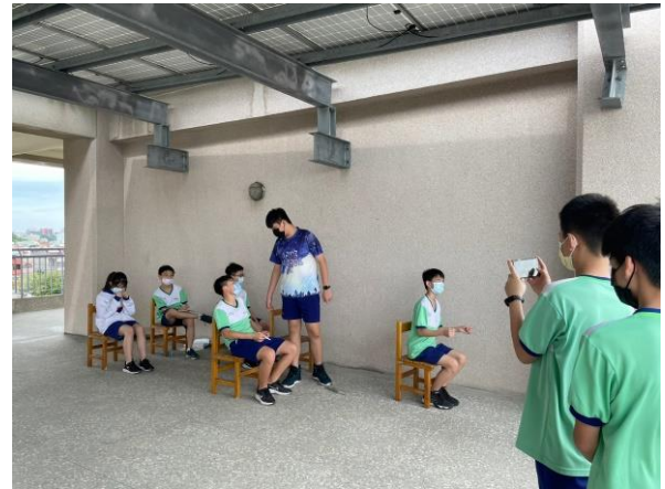
菸檳危害防制教材融入表演藝術課程教學活動——結合表演無所不在章節，結合菸檳防制主題創作劇本演練，班級拍攝後製完成短片作品