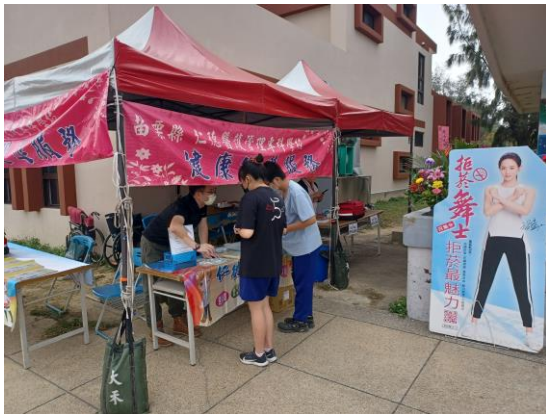
校慶運動會結合仁德護專健康醫護團隊設立菸檳防制健康宣導攤位，介紹同學認知菸檳危害對人體的影響，並提供相關衛教諮詢