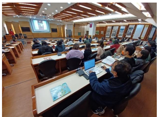
111學年度第一學期全校教師無菸檳校園宣導