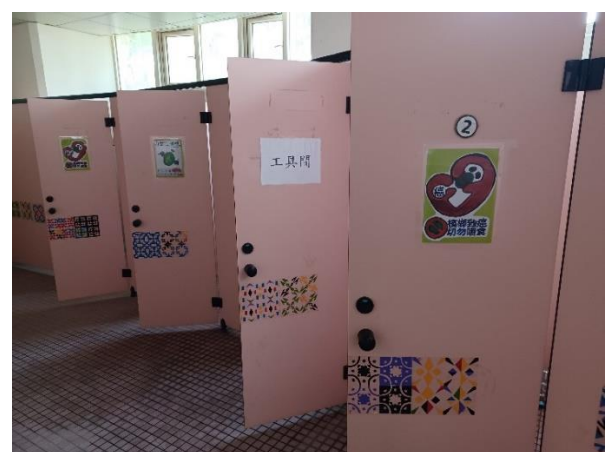
藉由校園廁所美化結合反菸拒檳主題，宣導班級學生健康禁菸檳危害觀念，達成境教效果