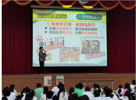
師生朝會宣導學校健康促進議題—電子菸對人體危害