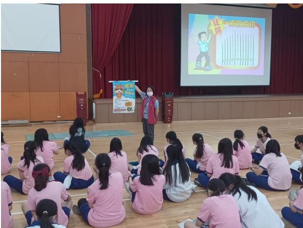
結合社區竹南衛生所醫護團隊人員，提供學生菸檳防制相關衛教教育與支援諮詢