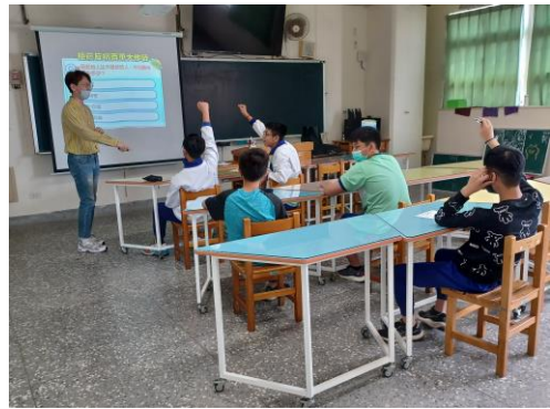
辦理菸、檳危害防制高關懷小團體輔導，針對高風險學生進行菸檳防制教材教學，透過有獎搶答活動了解健康危害知多少