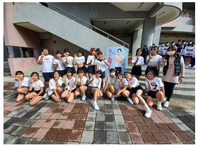
校園拒菸舞士快閃表演活動，透過熱舞表演展現健康活力，熱舞社同學成為拒菸舞士，宣導學生遠離菸檳危害的正當休閒活動