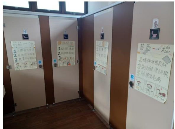
藉由校園廁所美化結合反菸拒檳主題，宣導班級學生健康禁菸檳危害觀念，達成境教效果