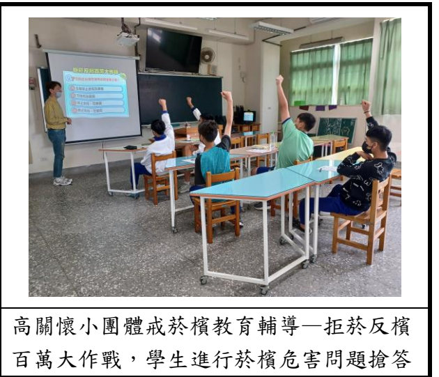
高關懷小團體戒菸檳教育輔導—拒菸反檳百萬大作戰，學生進行菸檳危害問題搶答