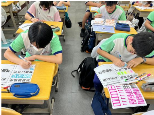
學生發揮創意創作菸檳防制標語 POP 美工字插圖活化標語