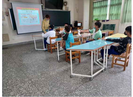
高關懷小團體戒菸檳教育輔導—拒菸檳四不練習曲，學生學習選擇適合自己的方式並演練回饋於心得學習單