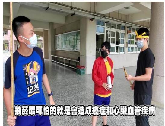
班級創作拍攝拒菸反檳短片作品，建構無菸檳健康校園文化