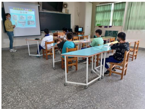
辦理菸、檳危害防制高關懷小團體輔導，針對高風險學生進行菸檳防制教材教學，學生回饋課後感想及戒菸宣言