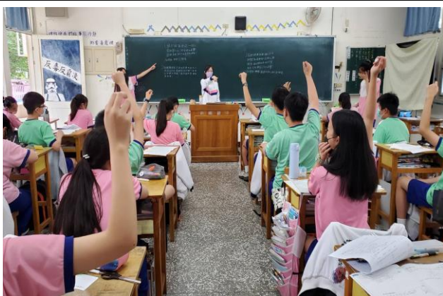
班會主題討論菸檳危害相關問題，共同探討並建構出對於菸檳對於人體影響的正確知識