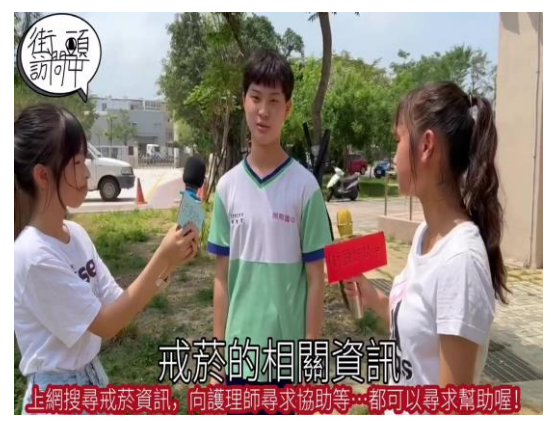
班級創作拍攝拒菸反檳短片作品，建構無菸檳健康校園文化