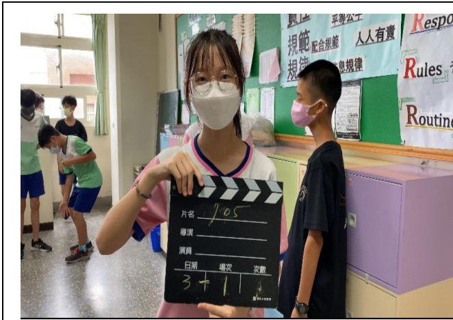
菸檳危害防制教材融入表演藝術課程教學活動——結合表演無所不在章節，結合菸檳防制主題創作劇本演練，班級拍攝後製完成短片作品