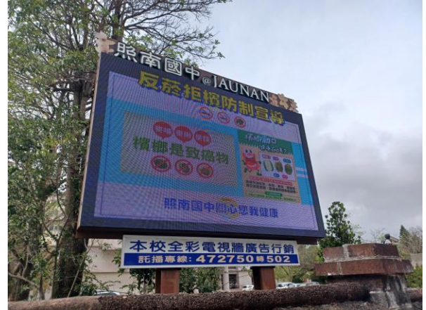
校門口LED電子看板播放菸檳危害防制相關宣導訊息