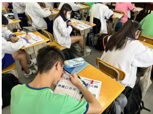
學生發揮創意創作菸檳防制標語 POP 美工字插圖活化標語