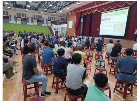
學校辦理親師座談會暨家長菸檳防制宣導，邀請家長共同響應無菸檳家庭，並提醒留意學生新型態電子加熱菸品