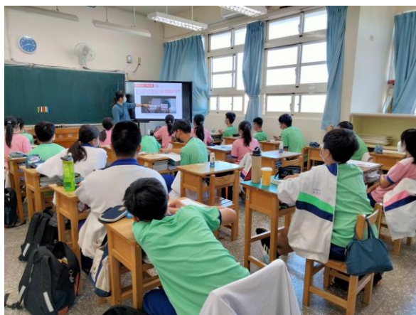
菸檳危害防制教材融入健康教育課程教學活動—結合拒菸我最行、酒與檳榔的世界章節，學生認知菸品及檳榔對人體危害影響