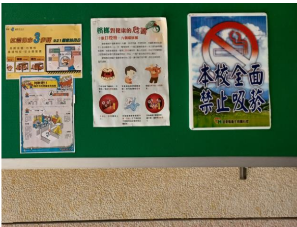
學校健康中心旁健康促進專欄張貼菸檳防制相關衛教海報及文宣