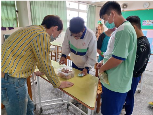
學生透過搶答正確及用心填寫回饋學習單內容，獲得獎金代幣換取獎勵品