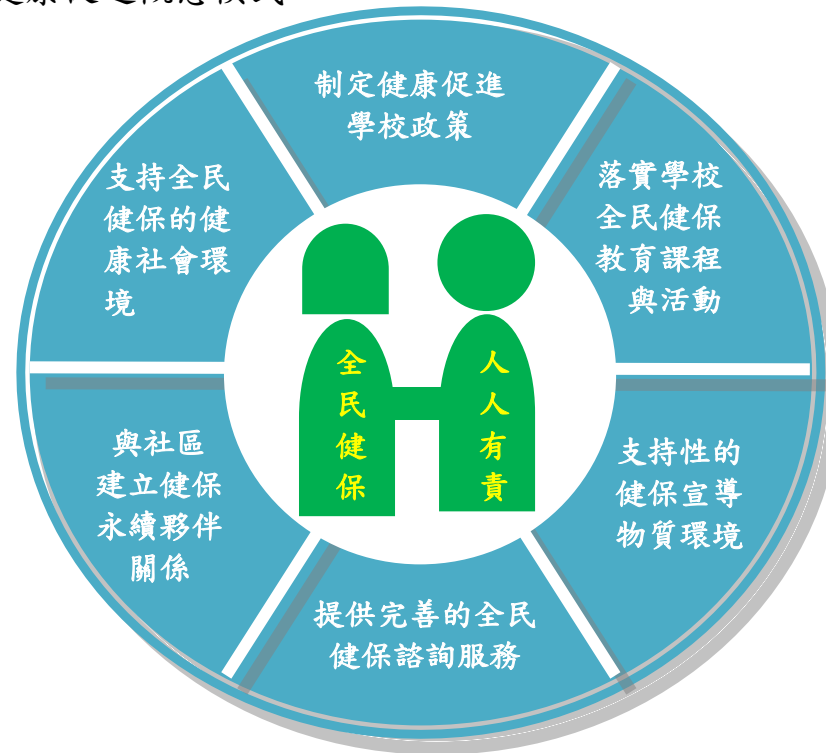
圖一 學校本位全民健保教育健康促進概念模式