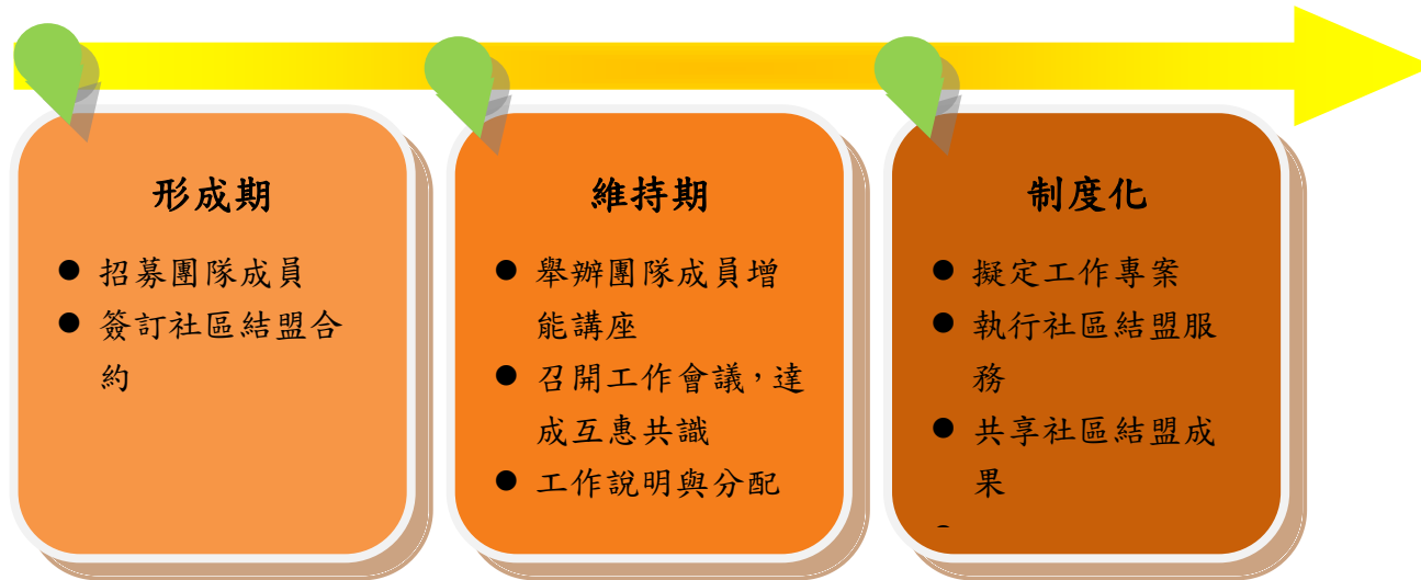
圖三 全民健保教育社區結盟行動工作流程